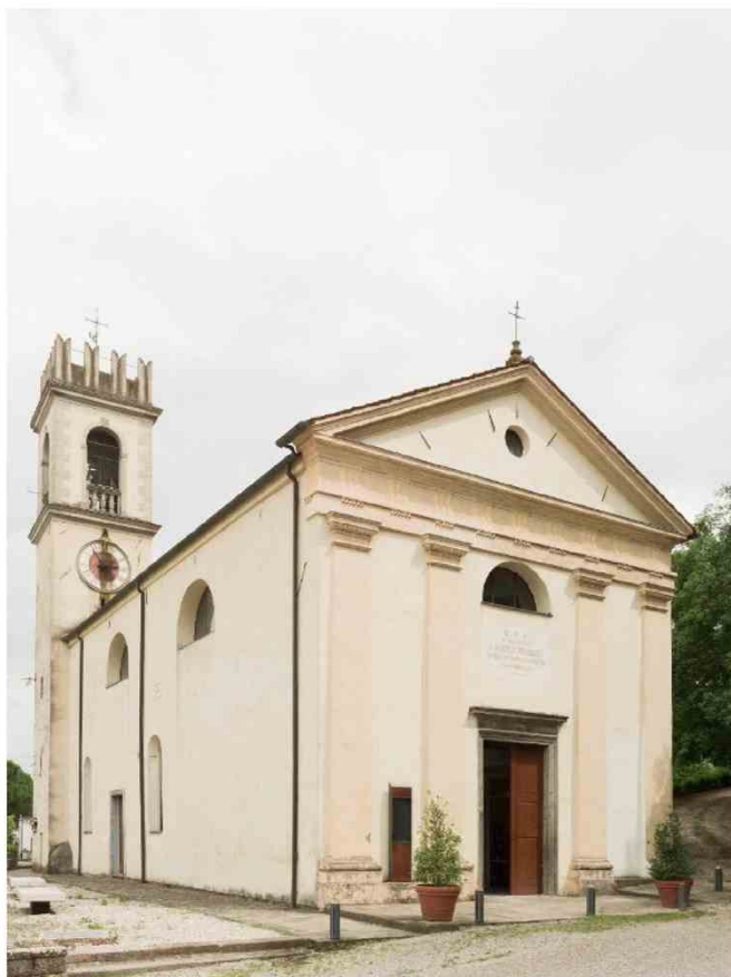
Vista esterna della biblioteca Comunale a Cervarese Santa Croce

Il restauro dello Studio Tommasi, iniziato nel 2003 e durato 15 anni, ha visto nella prima fase un intervento sull'involucro per il ripristino delle aperture originali e il rifacimento degli intonaci, oltre alla rimozione della vecchia scala interna. La seconda fase, dal 2007 al 2018, ha incluso l'eliminazione del muro al piano terra: al suo posto è stata inserita una struttura metallica di colonne e travi che valorizzano lo spazio della ex chiesa, facendone emergere gli elementi originali.