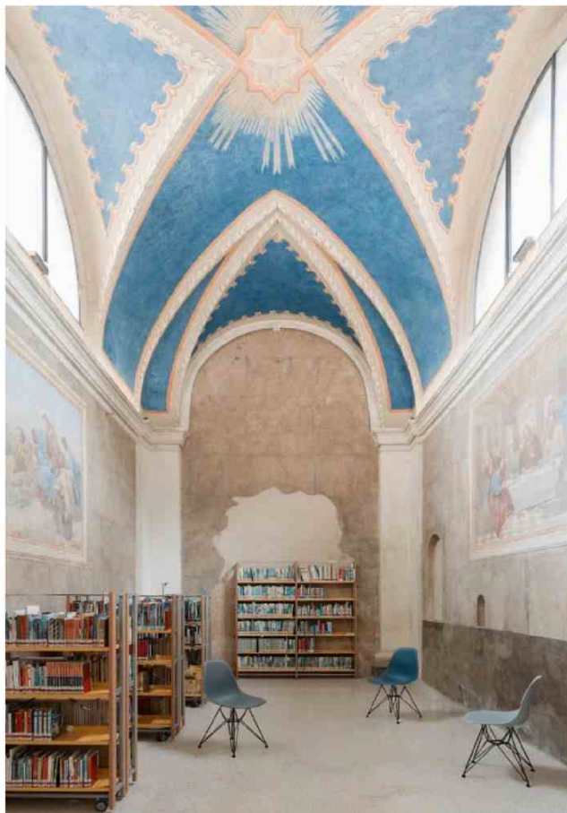
Studio Tommasi, biblioteca comunale a Cervarese Santa Croce, Padova, 2018. Interno.

A metà del Novecento la chiesa diventa una scuola e l'impianto originario viene del tutto trasformato con la creazione di un solaio, di murature per le aule e l'inserimento di un corpo scala. Quando alla fine degli anni '80 l'edificio diventa biblioteca comunale, è necessario apportare un nuovo intervento alla facciata e alla struttura, con l'obiettivo di rendere gli spazi idonei al nuovo programma e recuperare le aree della navata e del presbiterio.