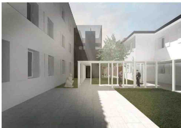
Nei render di Studio Tommasi, l'aspetto che assumerà il Palazzo delle Associazioni una volta completato l'intervento.